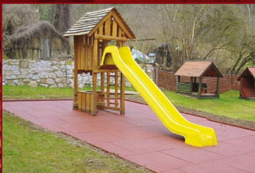
FALLSCHUTZMATTEN AUS GUMMIGRANULAT

HABEN WIR IHR INTERESSE GEWECKT? Rufen Sie uns gleich an.